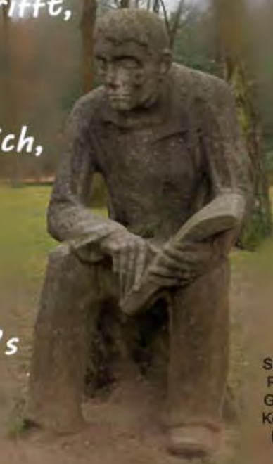
Bild: Statue im Park des Gottfried- Könzgen- Hauses, Haltern

Wer wandernd nicht Gefährten trifft, die besser, oder doch ihm gleich, zieh einsam fest die Straße fort - Gemeinschaft gibt's mit Toren nicht. Buddha