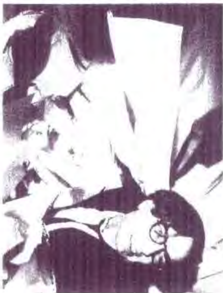
Stress adieu! Musse ahoi!

----- Unser Redaktionsteam nach getaner Arbeit für die Jubiläumsnummer 50 (mit 20 Seiten!)