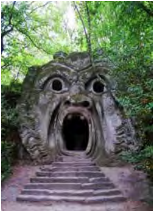
Orcusrachen, Parco dei mostri, Bomarzo